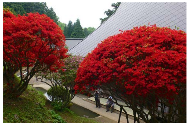
江戸時代を代表するツツジ「本霧島」（石川県珠洲市）。

近々、ナショナルコレクション認定制度の詳細や申請方法についてパンフレット等でお知らせできると思います。貴重なコレクションの情報も植物園協会事務局まで是非お寄せください。