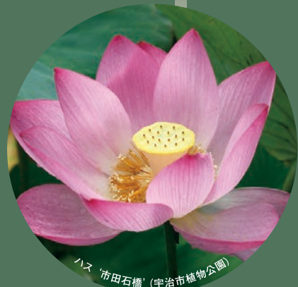
ハス '市田石橋' (宇治市植物公園)

「日本で栽培される貴重な植物や植物文化を守り、後世に伝える」ための ナショナルコレクション 保全制度と認定コレクションをご紹介します。 皇室ゆかりの伝統を受け継ぐ「新宿御苑菊花壇展」で 日本の伝統美の世界をご観賞いただきます。