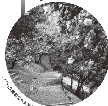
ツバキ(武田薬品京都薬用植物園)