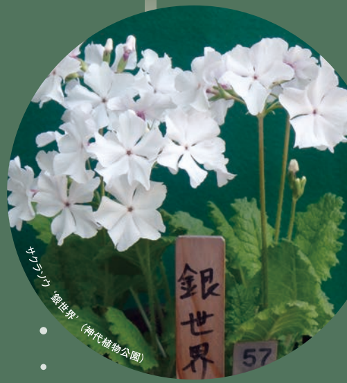
サクラヅク '銀世界' (神代植物公園)