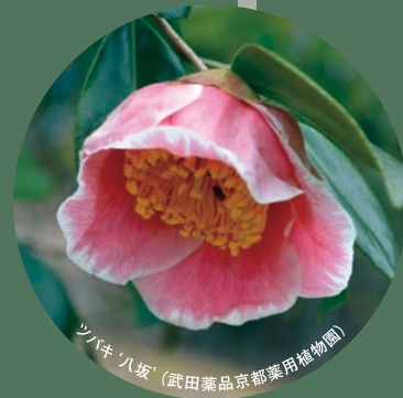
ツバキ '八坂' (武田薬品京都薬用植物園)

公益社団法人 日本植物園協会 第17回植物園シンポジウム ふるさとの植物を守ろう