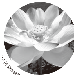
ハス(宇治市植物公園)