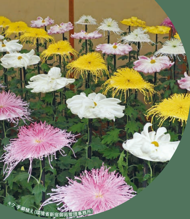
キク 手綱植え (環境省新宿御苑管理事務所)