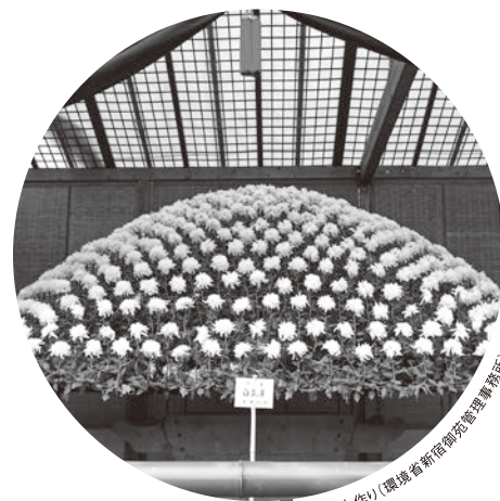
キク 大作川(環境省新宿御苑管理事務所)